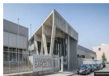
Escola de Barcelos, Portugália