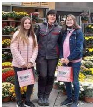
Agropreskrba Trgovska Druzba d.o.o.