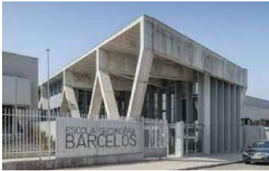
Agrupamento de Escolas de Barcelos