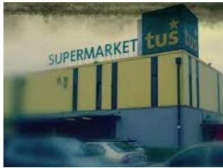
Tuš Holding d.o.o.