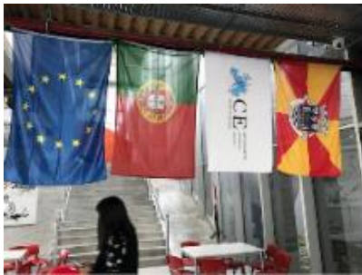
Agrupamento de Escolas de Barcelos European Club